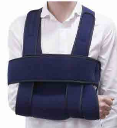
GT190004 IMOBILIZADOR DE OMBRO