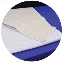
GT200005 RESGUARDO ANTI-ESCARA LÃ NATURAL