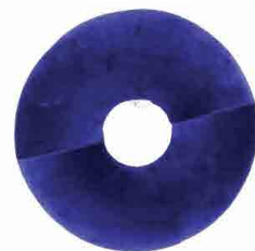
GT130008 COXIM ALGODÃO