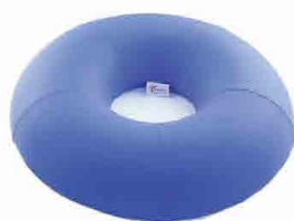
GT130009 COXIM BIOPRUF