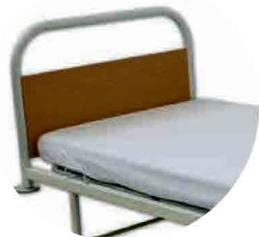
GT200003 RESGUARDO IMPERMEÁVEL TENCEL®