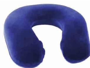
EQ110008 CERVICAL ANATÓMICA