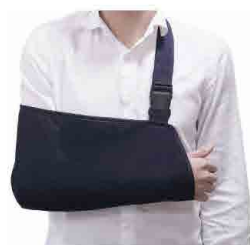
GT190001 SUPPORTO DE BRAÇO