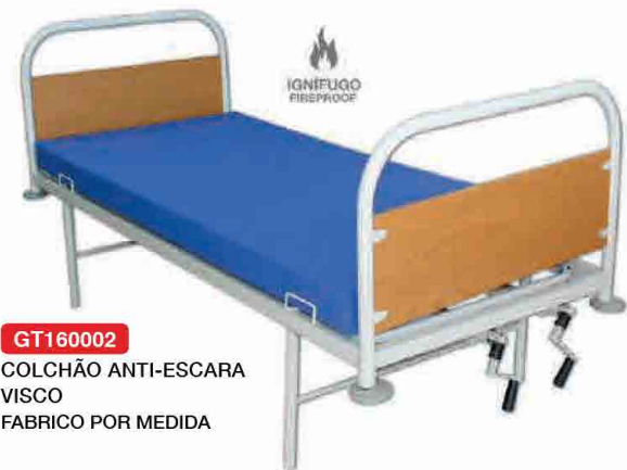
GT160002 COLCHÃO ANTI-ESCARA VISCO FABRICO POR MEDIDA

Colchões e resguardos anti-escara que auxiliam no tratamento e prevenção de escaras ou úlceras de pressão.