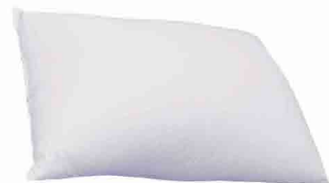
GT130004 ALMOFADA DE DESCANSO