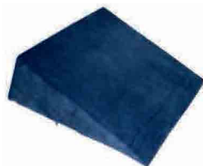
GT140003 ALMOFADA CUNHA 20 cm