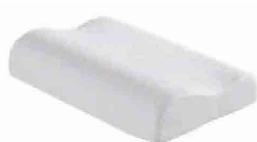
EQ110006 ALMOFADA ANATÓMICA VISCOELÁSTICA